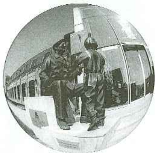
Le Musée de la Dentelle vue par Gino Gamberini

Exposition Photos de Gino GAMBERINI « ONIG » Au grenier de la Bibliothèque Victor HUGO Exposition visible aux heures d'ouverture de la bibliothèque Au grenier de la Bibliothèque Victor HUGO